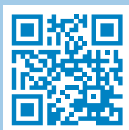
Structure de l'école obligatoire vaudoise